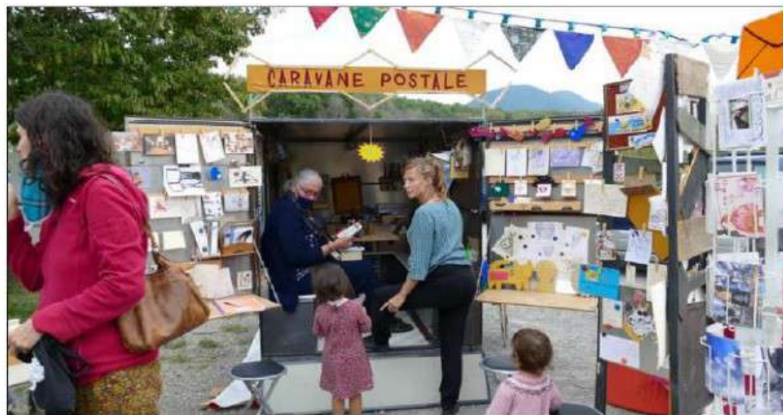
Pour ce dernier marché de la saison, le marché du coin recevait la caravane postale.

Concrètement, comment ça marche ? Un accompagnateur est là pour accueillir, faire découvrir l'espace, le fonc-