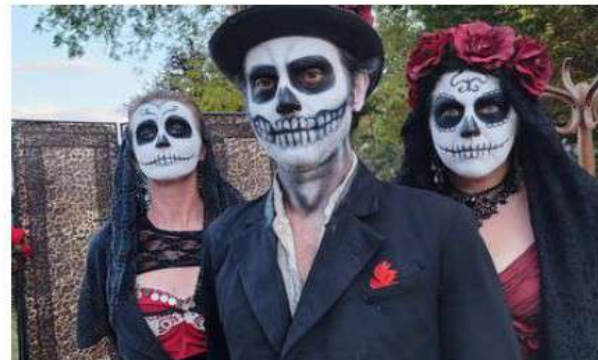
La compagnie Pas de Traverse a fait planer un air de Santa muerte avec son spectacle Batucamuerte.