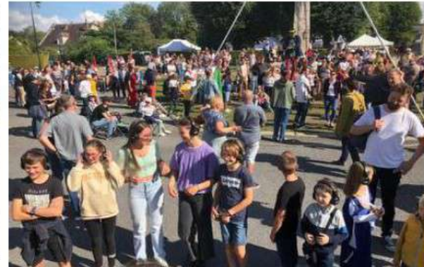
Munis de casque, les spectateurs volontaires sont devenus acteurs d'un spectacle.