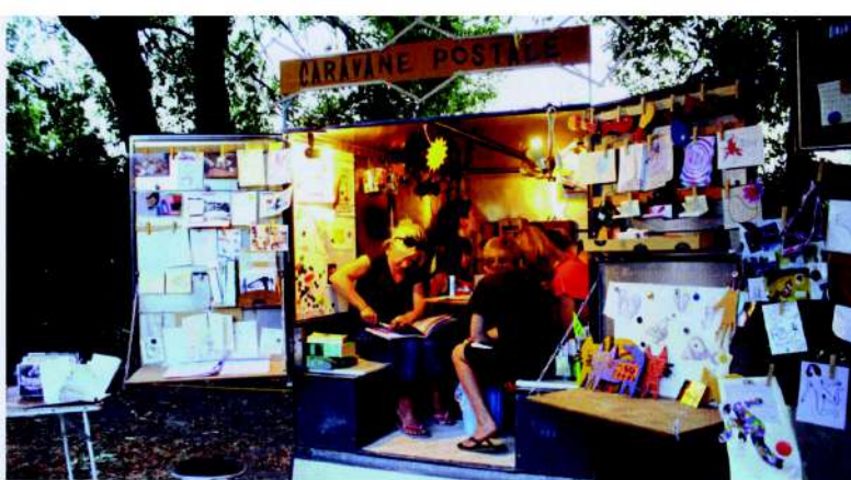
La caravane, ce bureau d'art postal, accueille le public pour s'approprier l'espace et le concept créatif.