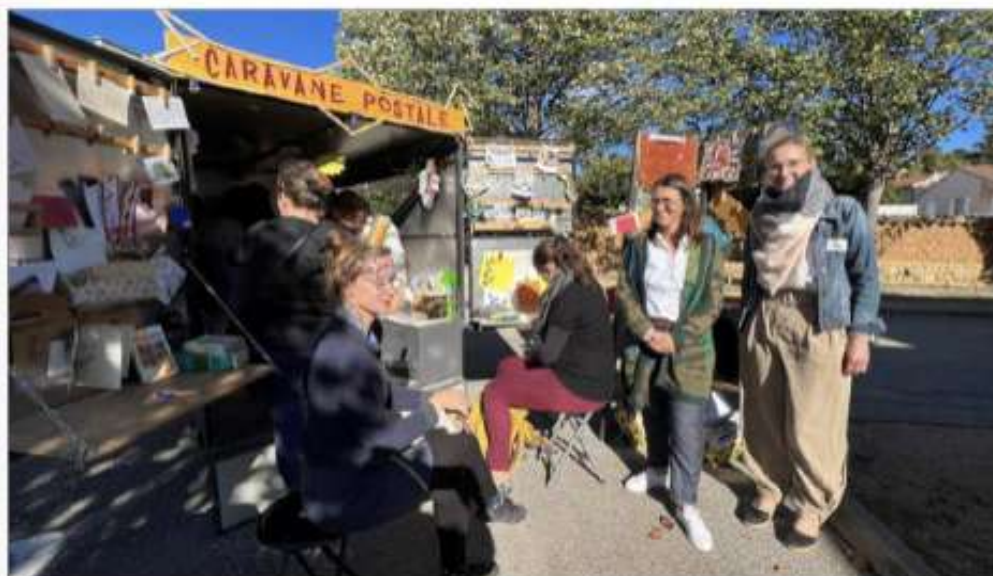
Une caravane "Timbrée" pour écrire et donner de ses nouvelles.

Le vernissage de l'exposition "la Timbrée" s'est déroulé, ce samedi 15 octobre, à la média-