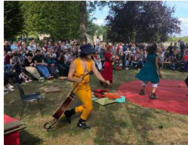
Le théâtre de rue fait partie des classiques à voir lors des Automnales.